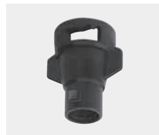
Verlängerungsadapter* System MULTIJET (092.163.56.00.23.1) Verlängerung: 32 mm