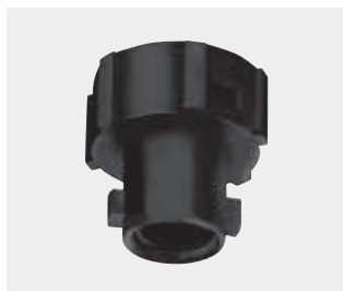
Zwischenadapter* System Lechler TWISTLOC (092.163.56.00.22.1) Verlängerung: 22 mm