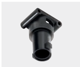
Zwischenadapter* System Rau (092.163.56.00.21.0) Verlängerung: 20 mm