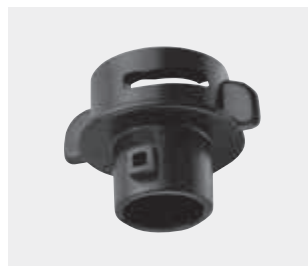
Zwischenadapter* System Hardi (092.163.56.00.20.1) Verlängerung: 17 mm